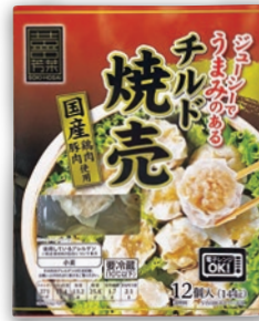
そうき芳菜 チルド焼売 (12個入)