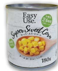
スーパー スイート コーン (180g)