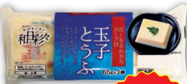
和日彩々 玉子とうふ (65g×3)