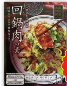
そうき芳菜 回鍋肉 (90g)