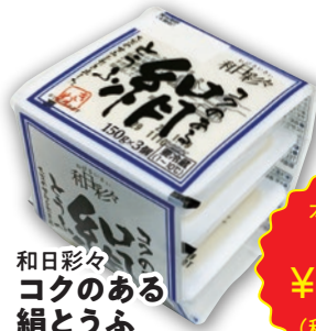
和日彩々 コクのある 絹とうふ (150g×3)