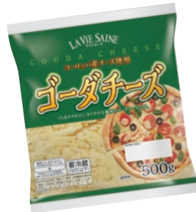
ラヴィセーヌ ゴダチーズ (500g)