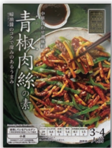
そうき芳菜 青椒肉絲 (100g)