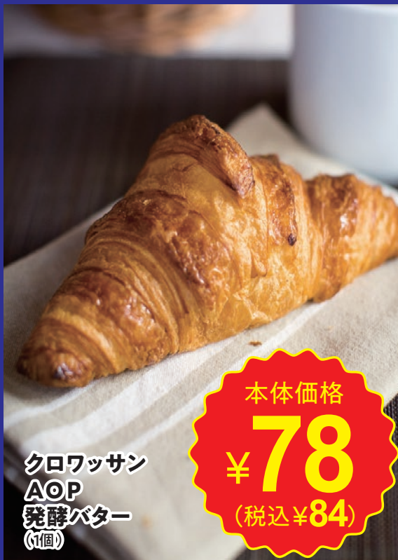
クロワッサン AOP 発酵バター (1個)