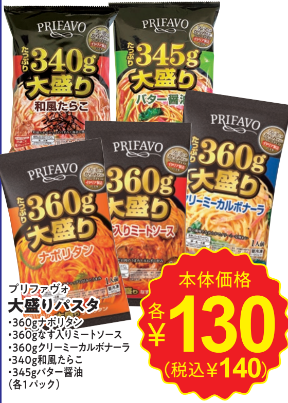
プリファヴォ 大盛りパスタ ・360gナポリタン ・360gなす入りミートソース ・360gクリーミーカルボナーラ ・340g和風たらこ ・345gバター醤油 (各1パック)