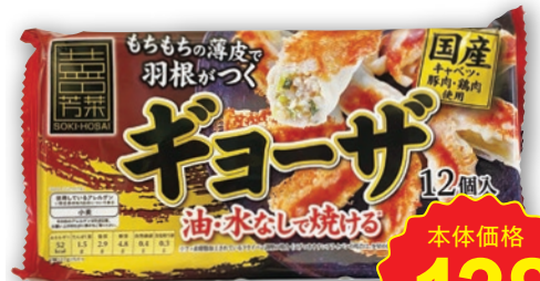
そうき芳菜 ギョーザ (12個入)