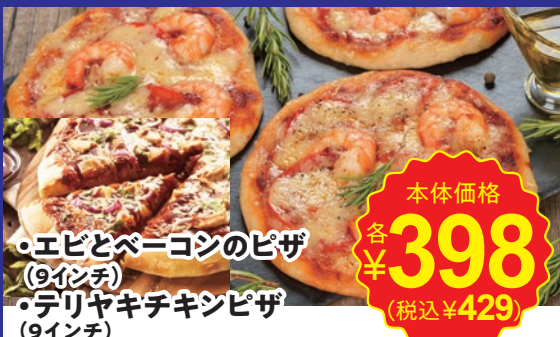
・エビとベーコンのピザ (9インチ) ・デリヤキチキンピザ (9インチ)